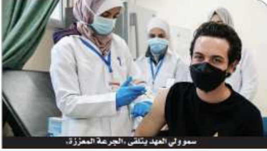
سمو ولي العهد يتلقى الجرعة المعززة،

أكد سمو الأمير الحسين بن عبدالله الثاني، ولي العهد، ضرورة الالتزام بالإجراءات الصحية المشبعة لمواجهة جائحة كورونا. ونشر سمو ولي العهد، عقب تلقيه الجرعة المعززة من اللقاح في مركز وادي السير الصحي الشامل مساء أمس الثلاثاء، عبر حسابه على «إنستغرام»: «مواجهة الوباء تحتم علينا جميعا الالتزام بالصالح الطبية التي وضعها خبراء من مختلف دول العالم». وأشار سموه إلى أن تلقيه الجرعة المعززة يأتي التزاما منه بالبروتوكولات الطبية المعتمدة. وختم ولي العهد حديثه، داعياً أن يحمى الله الجميع وموجهاً شكره للكوادر الطبية العاملة.