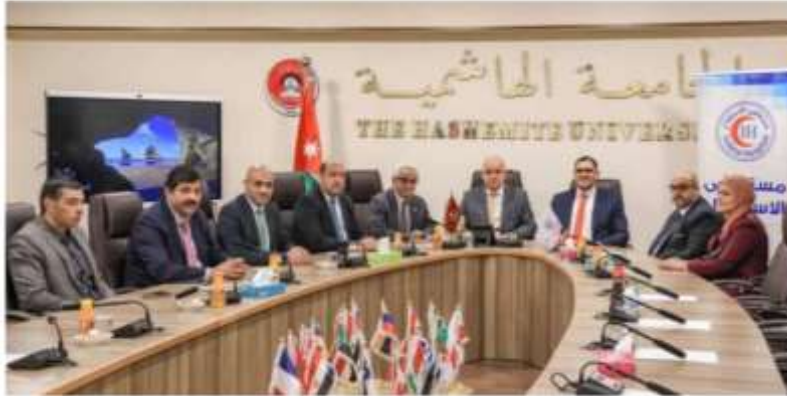
مدير مستشفى الاستقلال يوقع اتفاقية مع الجامعة الهاشمية لتوسيع مظلة التأمين الصحي

صراحة نيوز - في إطار حرص مستشفى الاستقلال على تقديم خدمات طبية متميزة تلبي احتياجات العملاء وتحقق رضاهم، تم توقيع اتفاقية جديدة مع الجامعة الهاشمية لتوفير خدمات الرعاية الصحية لموظفي وطلبة الجامعة.