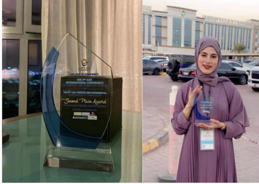
الشريط الإخباري :

خبر و صورة 2025-01-27 | 12:22 pm - الإثنين