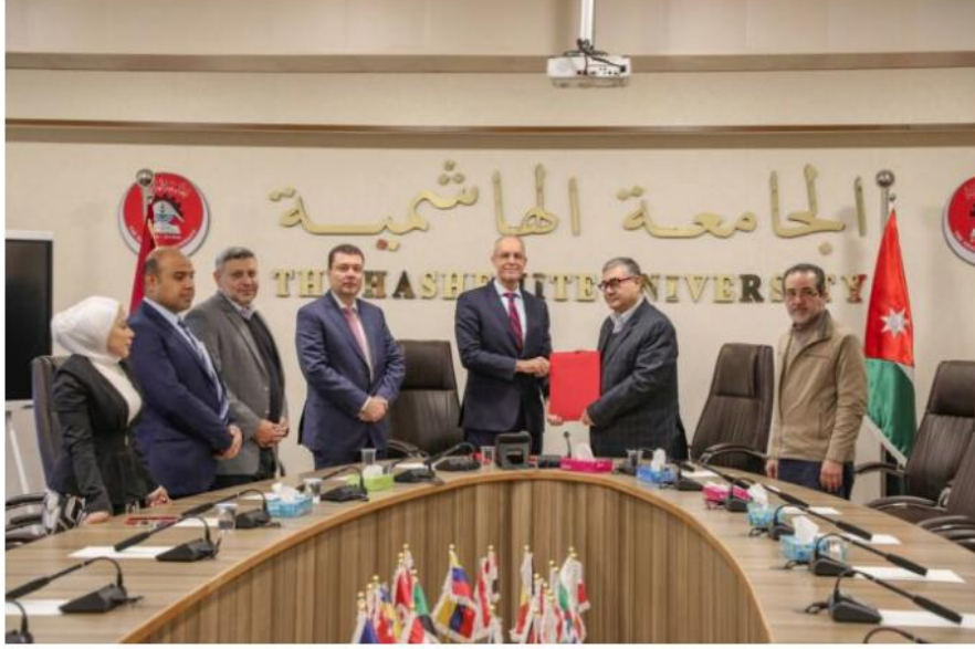
وكالة الجامعة الإخبارية