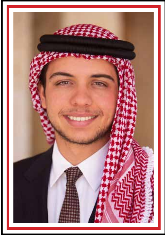
سمو الأمير الحسين بن عبدالله الثاني ولي العهد