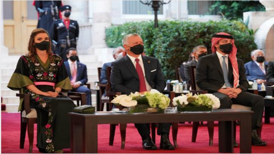
جلالة الملك عبدالله الثاني يرعى فعالية عيد استقلال المملكة الـ75 في قصر رغدان العامر (الديوان الملكي الهاشمي)

تاريخ الإنشاء 2021-05-25 18:08:57 آخر تحديث 2021-05-26 09:35:11