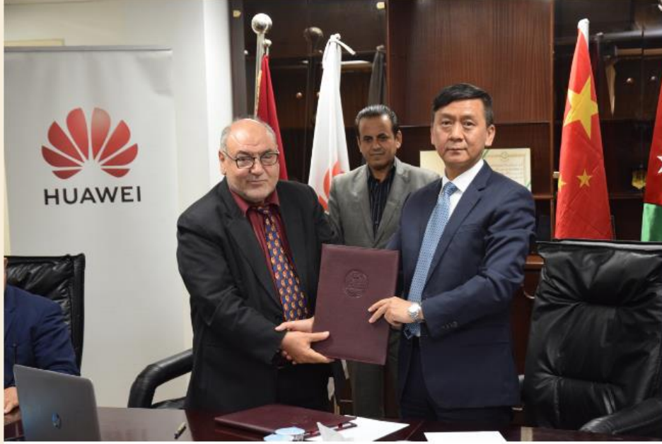
اتفاقية لإنشاء أكاديمية هواوي في الهاشمية