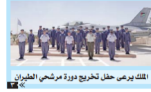
الملك يرعى حفل تخريج دورة مرشحي الطيران