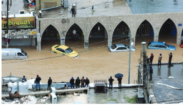
أمطار سابقة في غير موسمها تغرق شوارع عمان نتيجة التغيرات المناخية