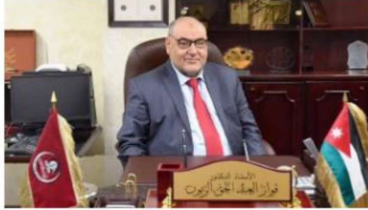
الحفيظة الدولية - عمان