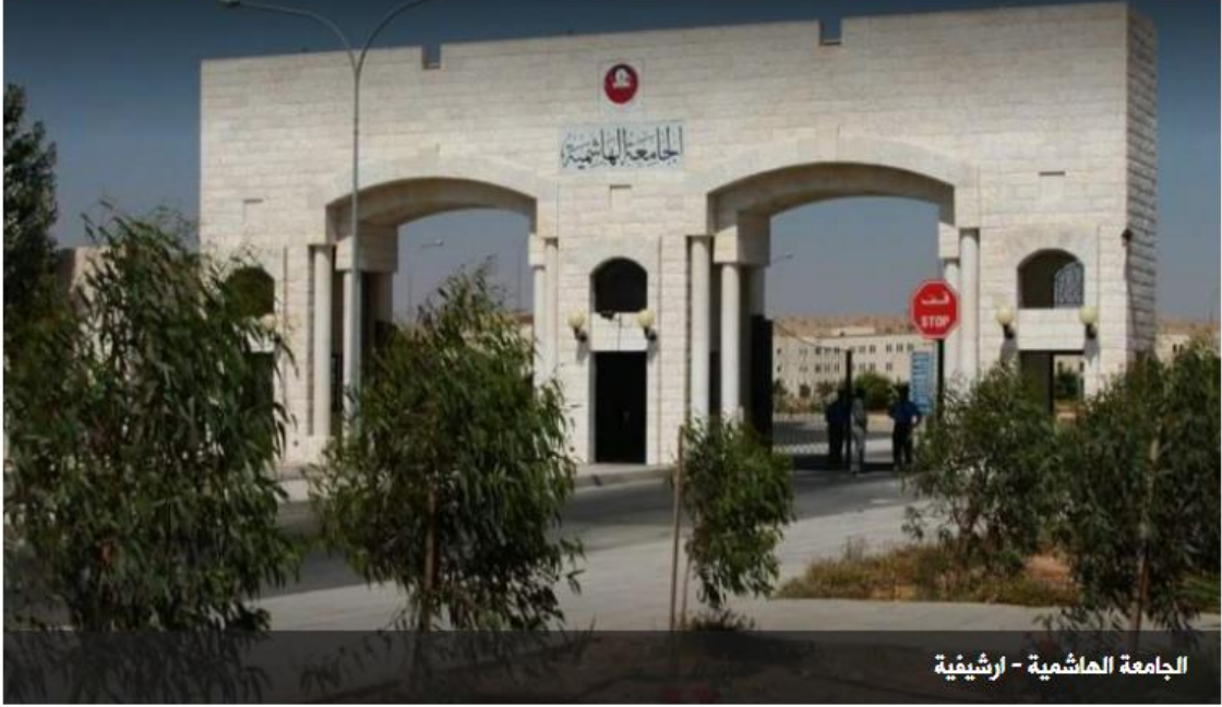
الجامعة الهاشمية - اربشيفية

محلّيات نشر: 15:33 03-07-2020 آخر تحديث: 15:33 03-07-2020